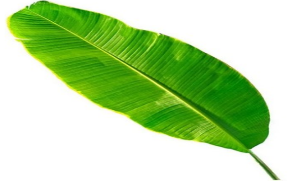
(ख). __ ला का पत्ता