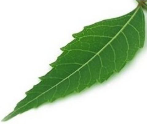
(ग). __ म का पत्ता