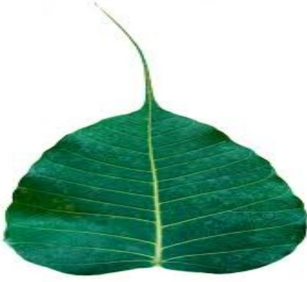
(क). पी __ ल का पत्ता

१० . नीचे दिए गए पत्तों के सामने उनके नाम लिखकर शब्द पूरा कीजिए।